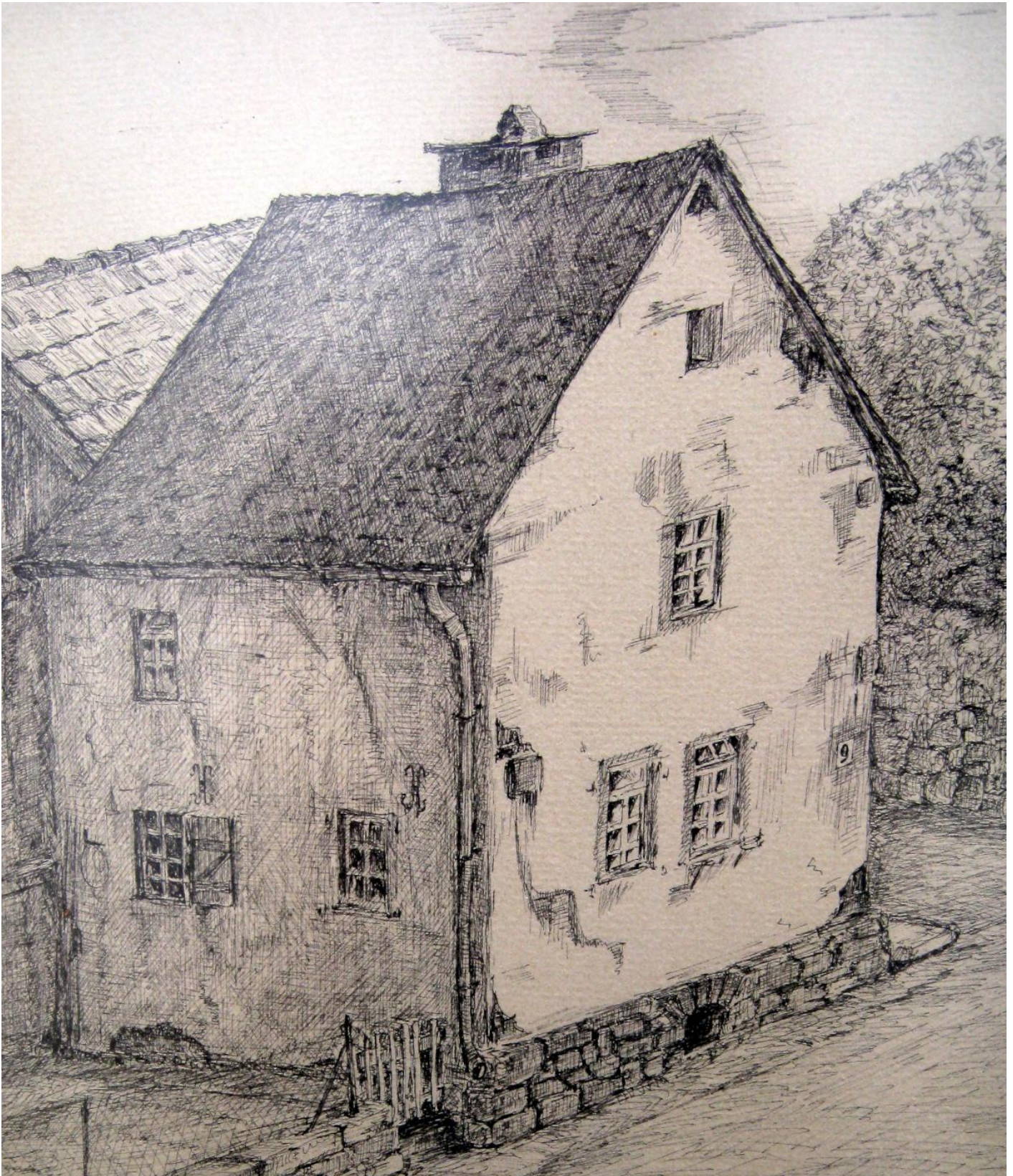
Zeichnung: Das Hauses von Familie Stein in der Schwerzstraße