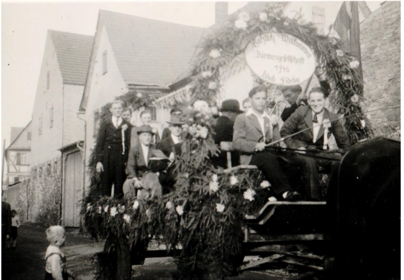
Foto: Der „Klub Fidelio“: Die Kirmesburschen 1946]Foto: Der „Klub Fidelio“: Die Kirmesburschen 1946 in der damaligen Mittelstraße (heutige Sonntagsstraße). Links im Hintergrund die Post, heute Backhausstraße 1

Foto: Der „Club der Weiberfeinde“: die Kirmesgesellschaft 1926 „Neubeck“]Foto: Der „Club der Weiberfeinde“: die Kirmesgesellschaft 1926 „Neubeck“- vermutlich in Anlehnung an die Gaststätte Neubeck, damals zu finden in der Unterstraße.