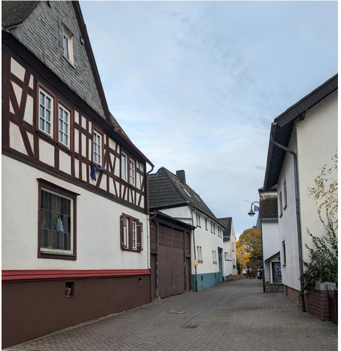
Foto: Die älteste Straße, Backhausstraße (Backesgass), David Diefenbach, 2023