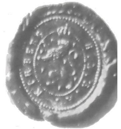
Foto: Siegel: N.G.A Mensfelden (links) und H.N.R.A. Kirberg (rechts)